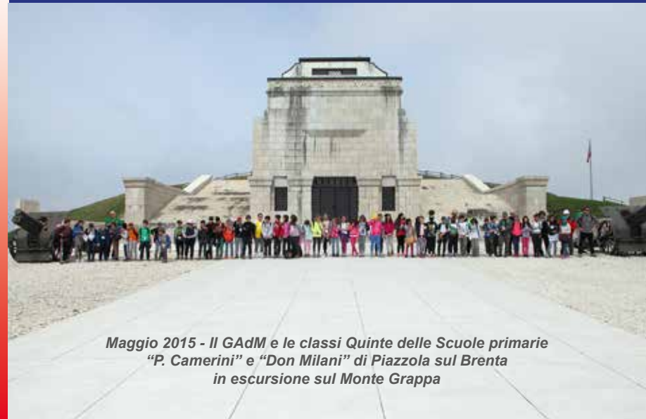
Maggio 2015 - Il GAdM e le classi Quinte delle Scuole primarie "P. Camerini" e "Don Milani" di Piazzola sul Brenta in escursione sul Monte Grappa